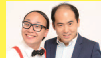
8R出演 トレディエンジェル