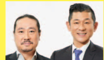
1・2・11・12R出演 笑い飯