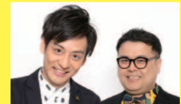
3~7・9・10R出演 ところサーモン