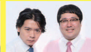
12R出演 マチカルラプリー