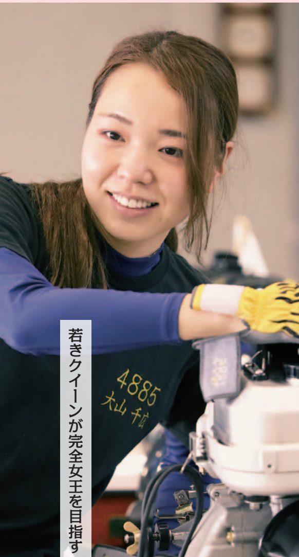
若きクイーンが完全女王を目指す