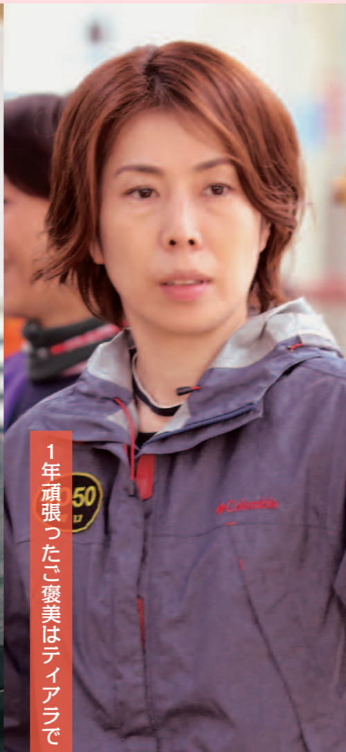
1年頑張った。褒美はティアラで