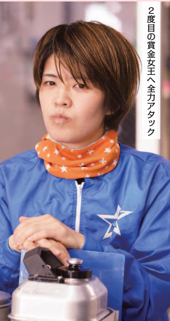
2度目の賞金女王へ全力アタック