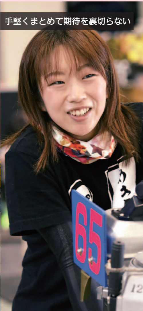
手堅くまとめて期待を裏切らない