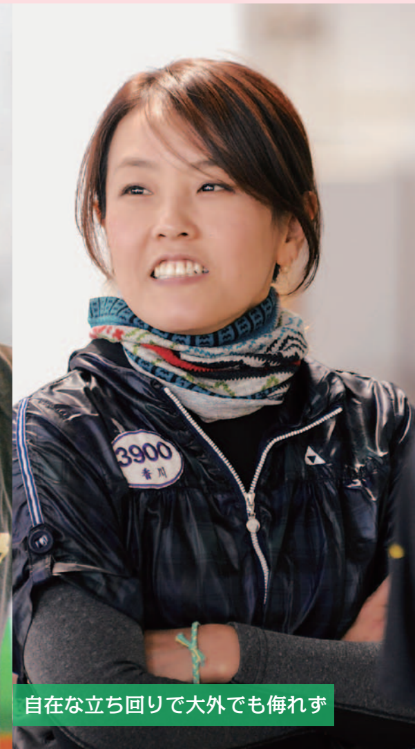
自在な立ち回りで大外でも侮れず