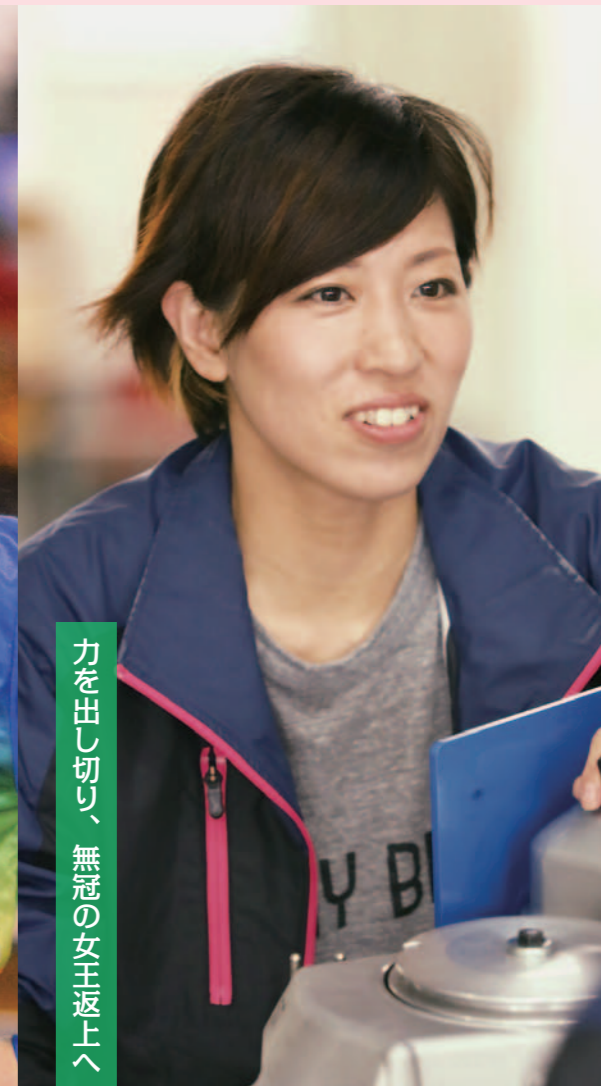
力を出し切り、無冠の女王返上へ