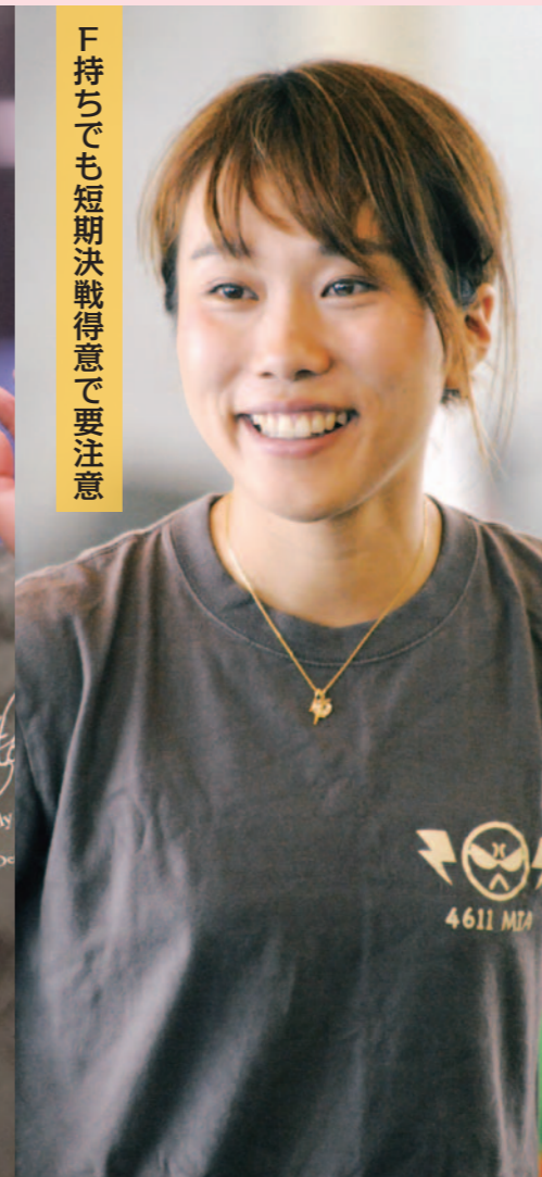
F持ちでも短期決戦得意で要注意