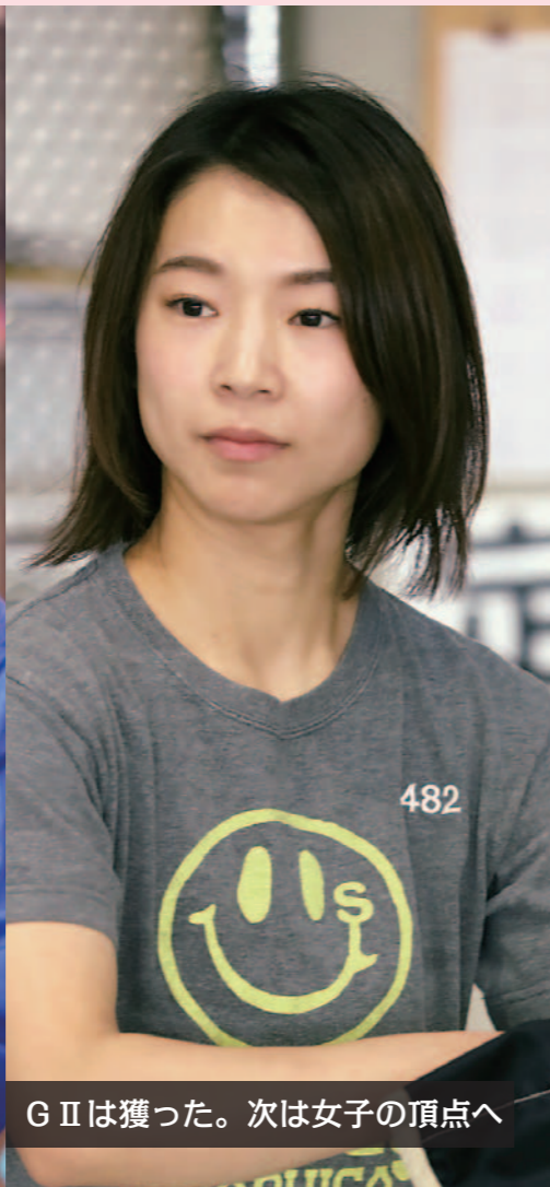
G IIは獲った。次は女子の頂点へ