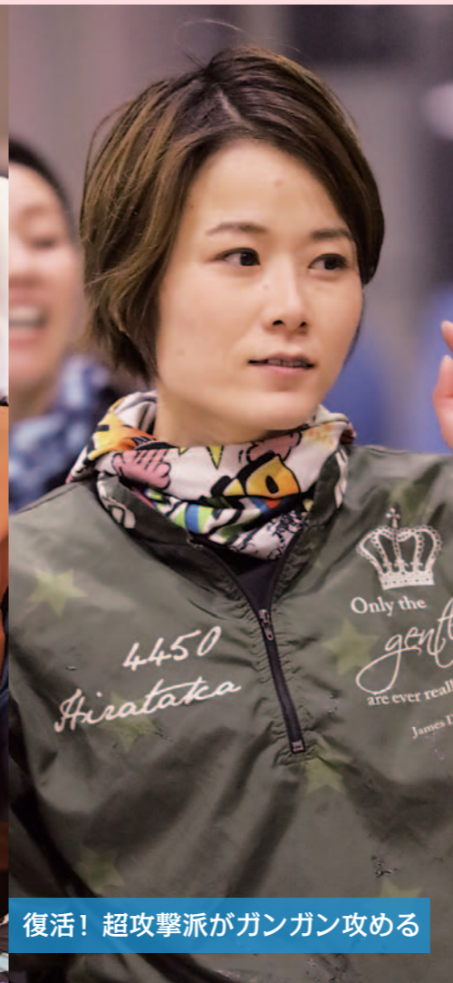
復活！超攻撃派がガンガン攻める