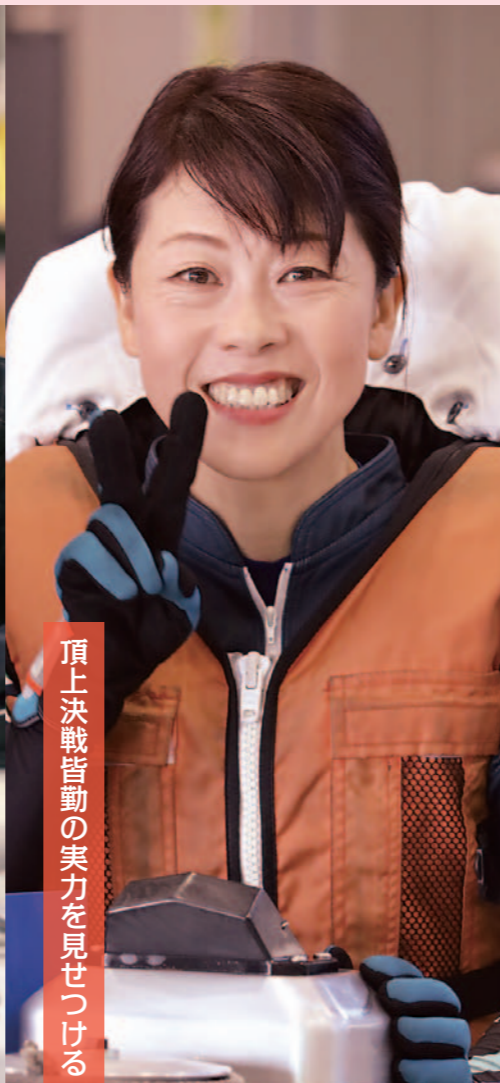
頂上決戦皆勤の実力を見せつける