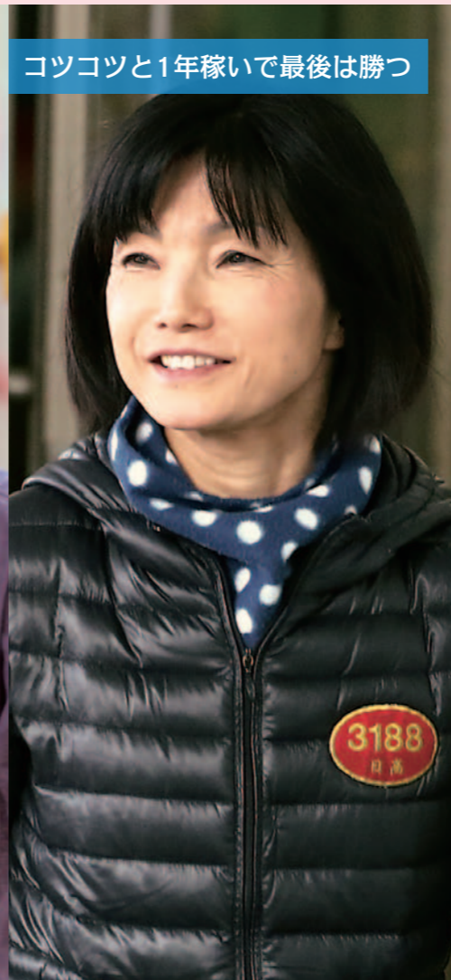
コツコツと1年稼いで最後は勝つ