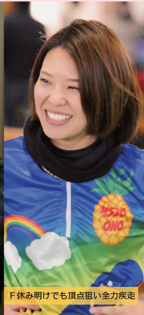
F休み明けでも頂点狙い全力疾走