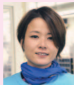
全国 6.53 下関 6.54 ナイター 6.18