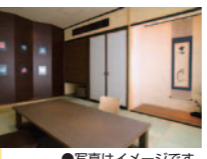
●写真はイメージです。A・三国観光ホテル賞

平成27年7月15日(水)より、17年ぶりにボートレース三国で開催されるレースは「SG第20回OOOOOカップ」です。OOOOOに入る言葉をお答えください。