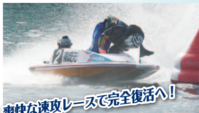
爽快な速攻レースで完全復活へ!