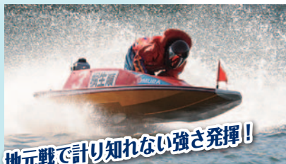
地元戦で計り知れない強さ発揮!

最後の走りでようやく白星を挙げたが、優勝戦では4号艇ながら「決める」ムードがあった。さあ、いよいよ地元戸田で本番だ。地元での強さはあんなものじゃない。計り知れないという言葉でしか表現できない、そんなレベルだ。