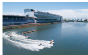
戸田の1マークはスタンド側に大きく振っている