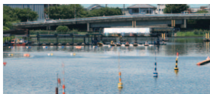
距離があるので、ピット離れに差が出る

佐藤「ピットから2マークまでは125.8mと距離があるので、ピット離れに差は出ます。自分はその間に遅れたことはないですけど、一応気をつかいますね。スタートは戸田に限らず、どこのレース場へ行っても難しいです。それに、モーターの仕上がり具合によっても変わってきますしね…」