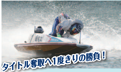
タイトル奪取へ1度きりの勝負!