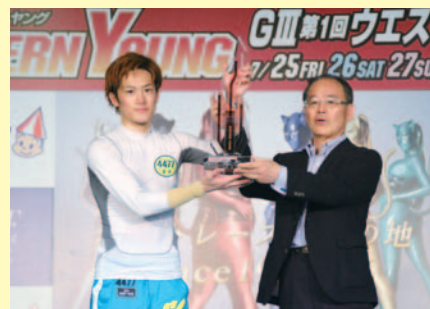
イースタンヤング、ウエスタンヤングとも既に出場権を手にして選手が優勝した

▶2連単 ①-④ 710円 (3番人気) ▶3連単 ①-④-② 1,600円 (5番人気) ▶決まり手=逃げ