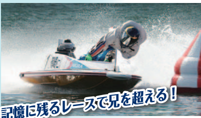
記憶に残るレースで兄を超える!