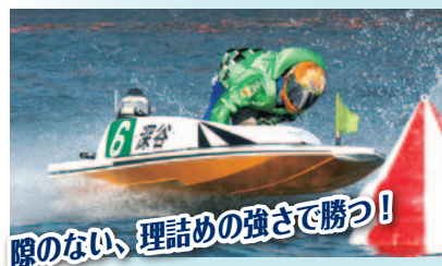
隙のない、理詰めの強さで勝つ!