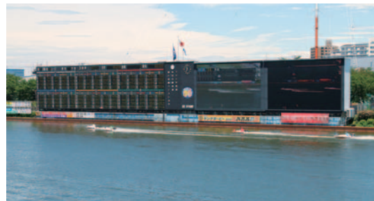
2マークのターンで流れるかどうかは映像画面でチェック

きが悪く、流れ気味の選手はテレビ画面の下中央部に消える。そんな選手も「捨て目」になる。