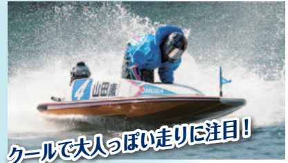
クールで大人っぽい走りに注目!