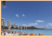
●写真はイメージです。