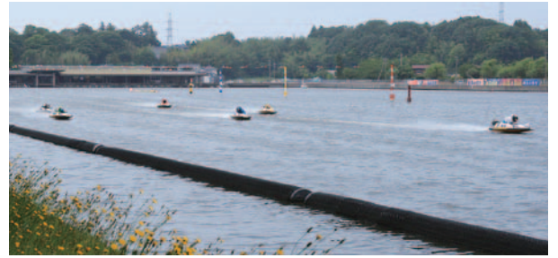
連率以上のパワーがあります。

一方、外コースの選手が絡んだだけで、高配当になることも珍しくありません。人気の1号艇の選手が2着や3着になっただけでも、同様に配当が跳ね上がります。「波乱になるかどうか」の見極めは、5m以上の強風が吹くなど、水面コンディションが安定していないときです。高配当期待の狙い目は、2、3コースの差しをアタマに、外枠を2、3着に絡める舟券です。