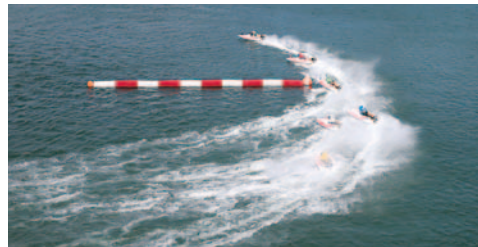
福岡の1マークは選手のテクニックが勝敗を決める

スタートライン上のホーム側は63.75mで全国で一番広い。住之江の51mと比較すると、その広さが分かる。2マークのホーム側の広さの77.5mも全国一である。競走用ボートの最大幅131.6cmだから、相手の動きを意識せずにスタートを切れる。ただ、2マークの奥行きがない