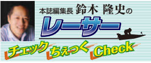
本誌編集長 鈴木 隆史のレーサー チェックおえっく Check

10/23 TUE 24 WED 25 THU 26 FRI 27 SAT 28 SUN BOAT RACE 福岡